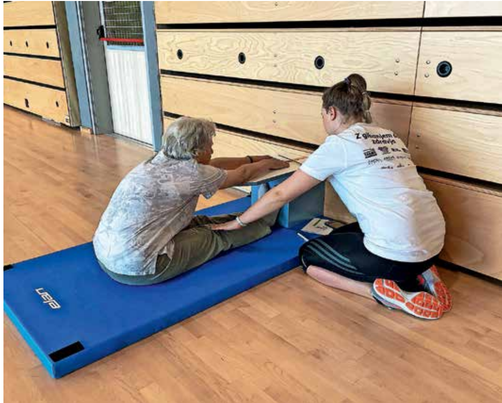
Lanski ŽIRfit je razgibal skoraj sto Žirovcev.

Svoj telesni fitness pa bodo udeleženci 18. maja lahko preverili na ŽIRfitu! Na tradicionalnem športno-družabnem dogodku bodo s sklopom meritev tudi letos merili telesni fitness posameznikov, ki vključuje preverjanje zmogljivosti srčno-dihalnega sistema, ravnotežja, moči telesa, koordinacije gibanja in gibljivosti. Po zaključku meritev, ki so prilagojene različnim zmogljivostim in starostim, sledi kratka analiza z nasveti o tem, kaj lahko posameznik sam stori za izboljšanje zdravja in dobrega počutja. Udeležbo na Žirfitu priporočajo starejšim od 18 let, tudi tistim, ki so se ga v preteklosti že udeležili in bi radi videli