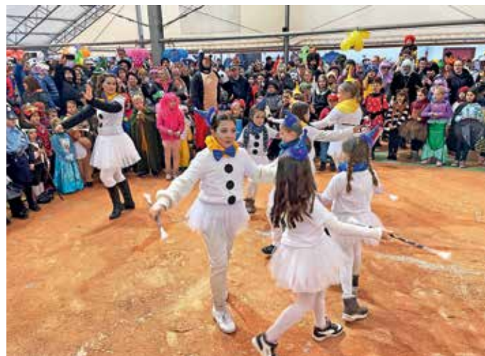
Pustno rajanje v Žireh

Tudi letos je bila naša gostja žirovska pihalna godba, ki so se ji pridružile male žirovske mažoretke. Lanski obisk mažoretk z Dolenjskega je namreč obrodil sadove. Rada bi se zahvalila Lari in Katjuši, ki sta poskrbeli za administracijo, ki je potrebna za izpeljavo dogodka, in pa seveda za aktivacijo svojih sodelavk, ki so